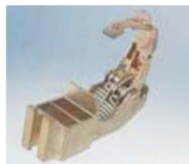
Δίδυμη ψηκτροθήκη εγγυώνται εξαιρετική μετατροπή ρεύματος