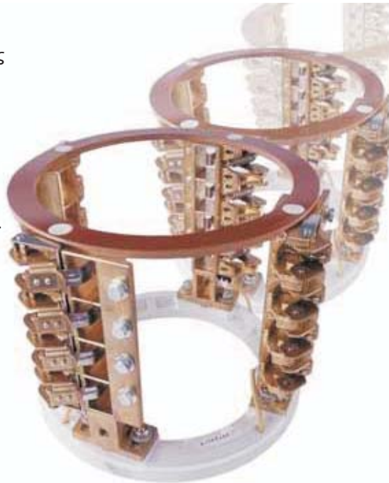
Ψηκτροφόρεας εξασφαλίζει καλή επαφή των ψηκτρών στον συλλέκτη

Οι κατασκευαστές ηλεκτρικών κινητήρων γνωρίζουν ότι μπορούν να βασίζονται στην Carbonex και ότι θα είναι ικανή να συνεχίσει να τους καλύπτει και στο μέλλον.