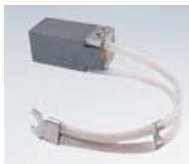
Βιομηχανικές ψήκτρες άνθρακα: Κορυφαία ποιότητα και μεγάλη διάρκεια ζωής