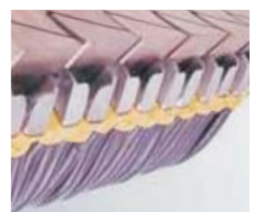
Τα προϊόντα της Carbonex είναι ανθεκτικά στα οξέα επιτυγχάνουν μια μόνωση με ένα σημαντικό μεγαλύτερο προϊόν ζωής από τις συνηθισμένες λύσεις