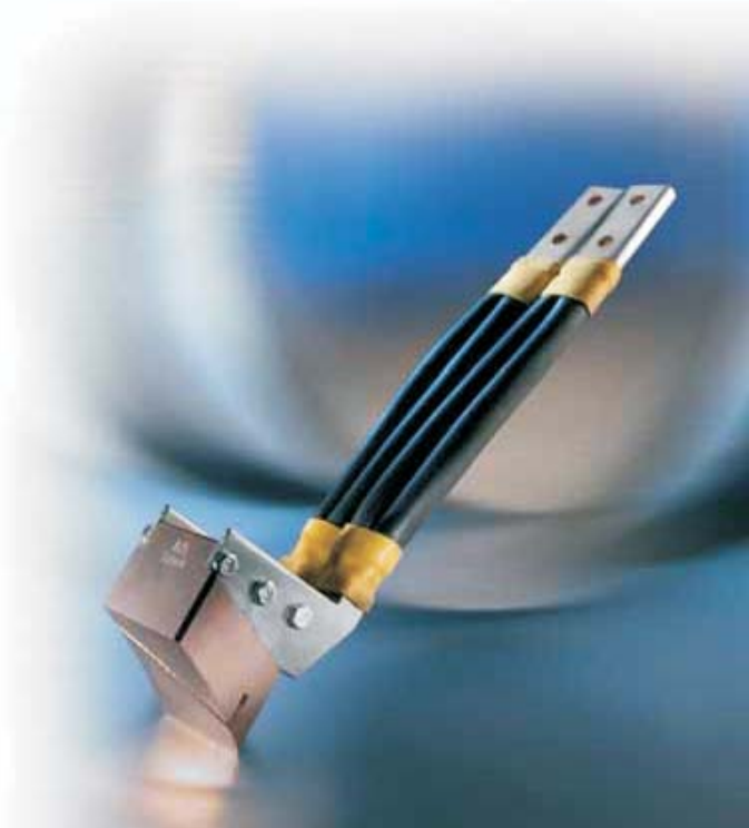
Καρβουνάκι με διαγώνια υποδοχή επιφάνειας και εξαιρετικές ιδιότητες μετάδοσης ρεύματος

Στον τομέα της μετάδοσης ρεύματος, δουλεύουμε ως ενεργοί εταίροι ανάπτυξης. Σε πολλά έργα που είναι σε θέση να εφαρμόσουν ειδικά υλικά μας παρέχουμε τεχνογνωσία σε πρώιμο στάδιο, προς όφελος των πελατών μας. Με συνεχόμενη εντατική συνεργασία με τους πελάτες μας, έχουμε εξασφαλίσει ένα υψηλό βαθμό απόδοσης και την ικανοποίηση του πελάτη. Εμείς συνεχώς προσπαθούμε να επιμηκύνουμε την ωφέλιμη διάρκεια ζωής των προϊόντων μας, καθώς και την ελαχιστοποίηση του χρόνου συντήρησης των μηχανών για τη μείωση του λειτουργικού κόστους.