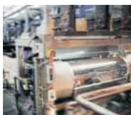
Εταιρείες επίστρωσης χρώματος βασίζονται στην υψηλή ποιότητα Carbonex προϊόντα για την ανοδίωση Αλουμινίου