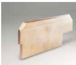
Μικροί συλλέκτες ρεύματος από την Carbonex: Ακρίβεια στο ρεύμα εκπομπή στην κινητή κατανάλωση ρεύματος