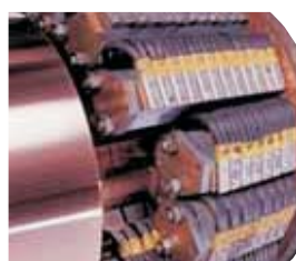
Οι ψήκτρες της Carbonex παρέχουν μια τρέχουσα μετάδοση άνω των 40.000 αμπερ