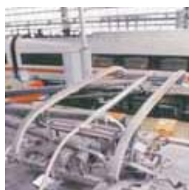
Ολόκληρος συλλέκτης Ρεύματος με επικάλυψη άνθρακα