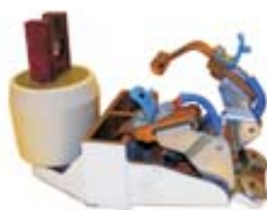
Διπλή ψηκτροθήκη με ελατήριο 'δάκτυλο'. Χυτοπρεσαριστή ψηκτροθήκη με δύο παράλληλες θήκες, διαφορετικό σχεδιασμό.