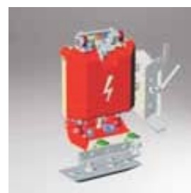
Παντογράφος για τρίτη σιδηροδρομική γραμμή, αυτό μόνωση με συντήρηση ρουλεμάν