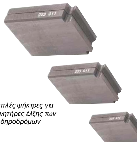
Διπλές ψήκτρες για κινητήρες έλξης των Σιδηροδρόμων

Η CARBONEX κατασκευάζει ψήκτρες για σιδηροδρομικά οχήματα για αρκετές δεκαετίες. Συρόμενες επαφές, με τη μορφή της ψήκτρας, είναι ένα σημαντικό στοιχείο της τρέχουσας μετάδοσης. Λόγω των ειδικών ποιοτήτων άνθρακα που χρησιμοποιούμε τα υλικά μας έχουν διακριθεί στον τομέα αυτό. Αυτό που είναι ιδιαίτερα εντυπωσιακό για της ψήκτρες CARBONEX είναι η ανθεκτικότητα στη φθορά τους, η προστασία του συλλέκτη και η καλή λειτουργία τους.