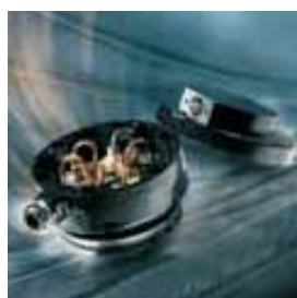
Η πρόοδος και η αξιοπιστία: Επαφές γείωσης από την Carbonex