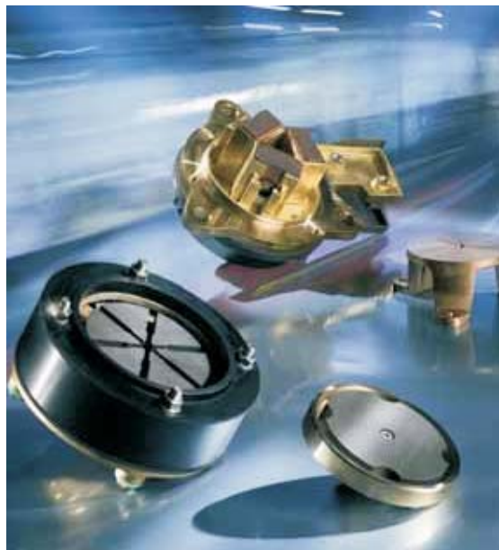
Συμβατικές επαφές γείωσης από άνθρακα

Η CARBONEX είναι ένας από τους μεγαλύτερους προμηθευτές Ράβδων Τριβής από άνθρακα χρησιμοποιώντας ειδική τεχνική συγκόλλησης. Όλοι οι Ράβδοι Τριβής χαρακτηρίζονται από την υψηλή τους λειτουργικότητα, την εξαιρετική αντοχή τους σε θερμοκρασία, την σταθερή απόδοση και την ανθεκτικότητα τους στη διάβρωση καθ' όλη την διάρκεια ζωής τους. Άλλα βασικά χαρακτηριστικά είναι η αξιοπιστία κάτω από ακραίες περιβαλλοντικές συνθήκες. Εκτός από την εξαιρετική ηλεκτρική χωρητικότητα και τη μακρά διάρκεια ζωής των Ράβδων Τριβής μας, οι πελάτες της CARBONEX εκτιμούν την ευκολία της συντήρησης τους και φιλικότητας προς το περιβάλλον. Επίσης, έχουμε αποδείξει την καινοτομία, μέσω της χρήσης των στοιχείων πολυπλεξίας, χαμηλά επίπεδα θορύβου ολισθαίνουσες επαφές και ποιότητες μέταλλου εμποτισμένες χωρίς μόλυβδο.