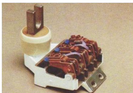
Ψηκτροθήκη για κινητήρες έλξης. Χυτοπρεσαριστή Ψηκτροθήκη με τρεις θήκες φλάντζα για εύκολη προσαρμογή στον Ψηκτροφορέα.