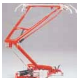
Παντογράφοι με υψηλό βαθμό πλευρικής αντοχής, μεμονωμένη αναστολή λωρίδων και υδραυλικό πλαίσιο απόσβεσης