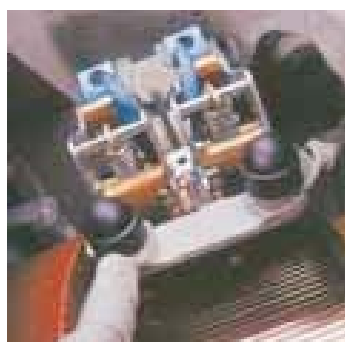
CARBONEX κάνει 700 διαφορετικά σχέδια ψηκτροθήκες για οχήματα έλξης για νέες μηχανές έλξης, καθώς και την επισκευή και συντήρησή τους