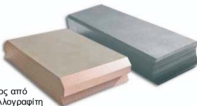
Συλλέκτες ρεύματος από άνθρακα και μεταλλογραφίτη για γερανούς