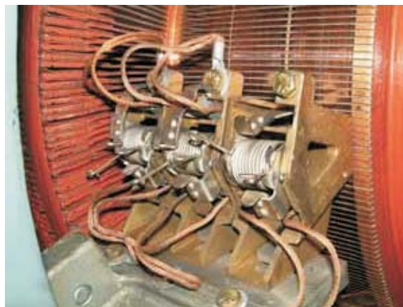
Ισχυρή απόδοση του κινητήρα με ψήκτρες και ψηκτροθήκες CARBONEX